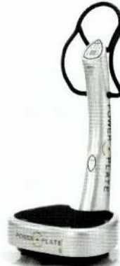
«my5»: das Komfortgerät für Zuhause