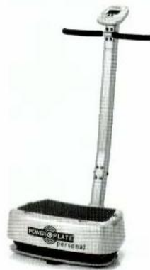
«Personal»: das Einstiegsgerät für Zuhause

Power Plate gibt es an unzähligen Standorten in der ganzen Schweiz. Ein Verzeichnis finden Sie unter www.powerplate.ch . Informationen gibt es auch bei jedem Arzt oder Therapeuten.