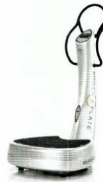
«pro5»: das Profi-Gerät